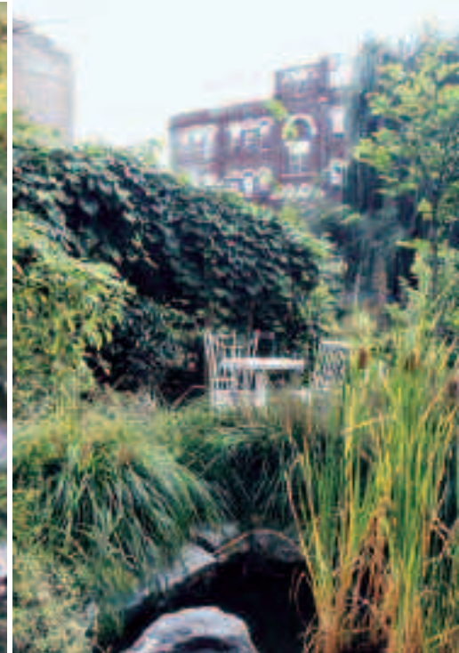
Immagini tratte dal libro "Loisada. NYC Community Gardens" di Michela Pasquali, Linaria Editore